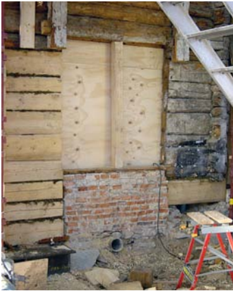
Frogner hovedgård. Et vindu som ble til dør som så ble gjenmurt – og så laget man badeværelse innenfor, med utløp gjennom grunnmuren.

Bygningsarkeologi er den uunnværlige metoden til å besvare spørsmålet: «Hva skjuler seg bak overflaten». Den gir pålitelig faktisk kunnskap om materialbruk, teknikk og relativ kronologi, men er ikke alene tilstrekkelig til å besvare spørsmål som «når», «av hvem», og «hvorfor». Her må bygningsforskeren ty til kildekombinasjon og supplere bygningsarkeologi med andre metoder. Direkte observasjoner, dokumentert ved oppmåling, fotografering og notater, er første trinn. I den videre analyse må undersøkelsene av selve objektet sammenholdes med studier av skriftlige, billedlige og muntlige kilder. Endelig må forskeren bruke induktive metoder som komparasjon og analogislutninger for å danne hypoteser om bygningshistorien. De kan i sin tur gi grunnlag for videre teoridannelse og nye spørsmål som bør kunne besvares gjennom flere bygningsarkeologiske inngrep og dypdykk i kildene. Prosessen får karakter av en hermeneutisk sirkel, som for hver omdreining øker forståelsen for fenomenet, og i sin tur reiser nye spørsmål.