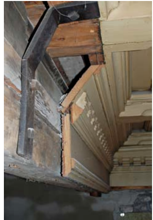
Drammen station, rom A. Hans Jacob Hansteen foto 2010.

Frogner Hovedgård. Bygningsarkæologi er den uundværlige metode til at besvare spørsmålet: «Hvad skjuler der sig bag overfladen». Lars Roede foto 2007.