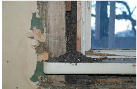
Saxegaarden, Oslo. Når man har mus i huset...

I bygningsarkeologien forteller tidslagene historie på flere nivåer: arkitektur- og kunsthistorie, bygningens historie, historien om livet i bygningen, konstruksjonens og materialenes historie. I dag er forvaltningen av de arkitektoniske kulturminnene også et arbeidsområde for arkeologer, etnologer, tekniske konservatorer, historikere og kunsthistorikere, såvel som antikvarer og museumsfolk. Det er derfor et stort behov for å øke forståelsen for bygningsarkeologien, diskutere bruk av nye digitale teknikker, og for å utvikle samarbeid mellom de forskjellige faggruppene.