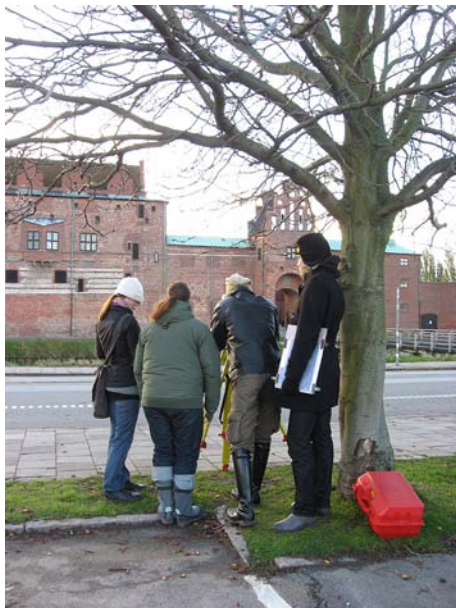
Studenter på övning med totalstation. Gunilla Gardelin foto 2010.