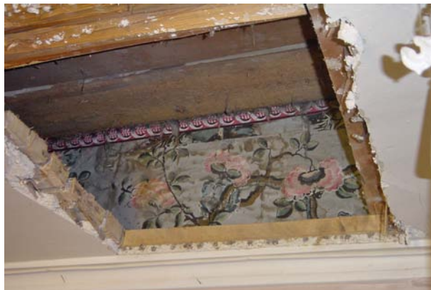
Frogner hovedgård. Tapet i rum 116 b.

Konferansen arrangeres i et samarbeid mellom Nordisk forum for bygningsarkeologi, Norsk institutt for kulturminneforskning (NIKU, administrativt) og Arkitektur- og designhøgskolen i Oslo (AHO, konferanselokaler).